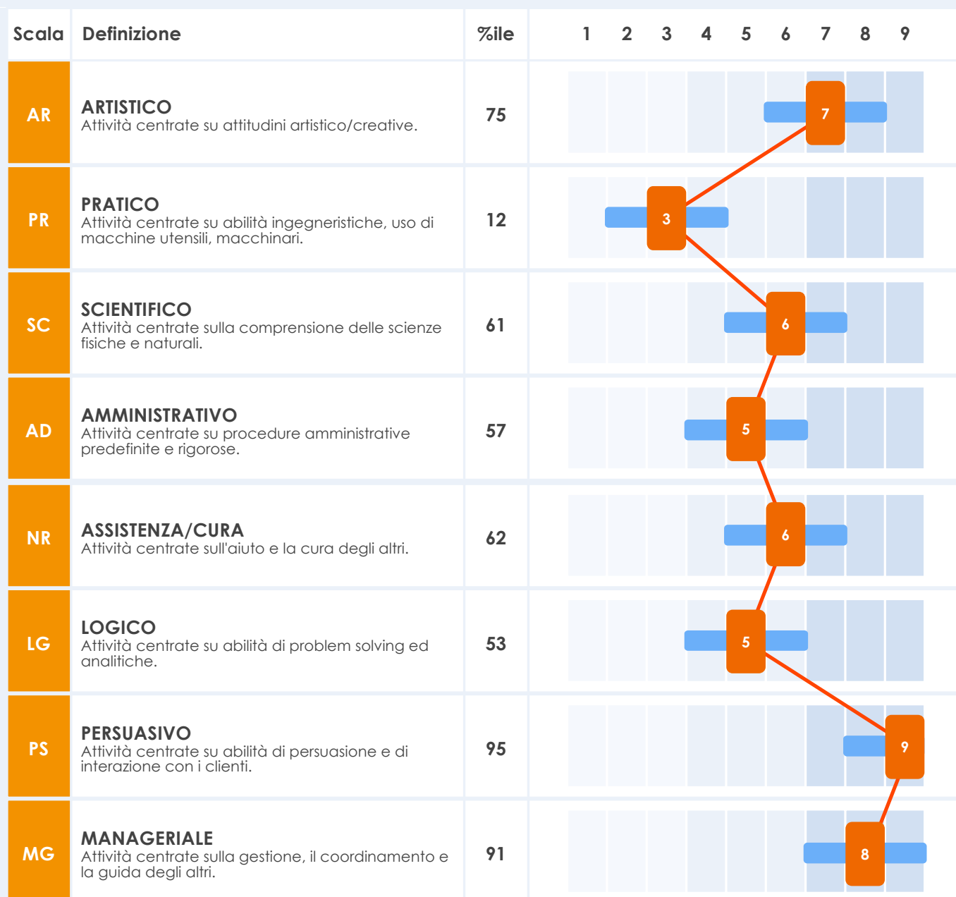
GRAFICO INTERESSI FORMATIVO-PROFESSIONALI

Il grafico sottostante riporta i punteggi sulle principali aree di interesse formativo-professionali. La gran parte delle persone si colloca su punteggi medi, quindi sono i punteggi più alti o più bassi quelli maggiormente caratterizzanti la persona esaminata.